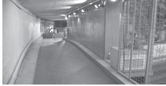
صورة رقم (6) استغلال جانب الكوبري في عرض اللوحات

المناطق الواقعة أسفل الكباري سواء علي ضفاف الأنهار أو في أي منطقة أخرى.