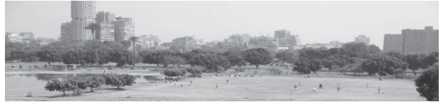
صورة رقم (2) مركب شباب الجزيرة

تتمثل الاستعمالات علي تلك الضفة من الجزيرة في ثلاث أجزاء رئيسية بداية من فندق الماريوت وقصر عمر الخيام ثم الجزء الأوسط المتمثل في العمارات السكنية الفاخرة التي تم انشائها في العقود الأولى من القرن الماضي مثل عمارات "Pyramid house" و "Nile view" والتي يتوسطهم سفارة تونس، وينتهي بالجزء الثالث المتمثل في المسطح الأخضر لنادي الجزيرة ومركز شباب الجزيرة الذي يعبر من فوقه كوبري السادس من أكتوبر .