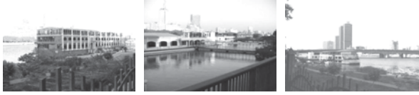
صورة رقم (4) المراكب النهرية التي تميز الواجهة الغربية لجزيرة الزمالك