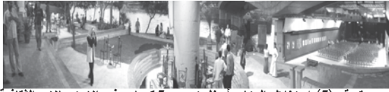
صورة رقم (5) استغلال المكان أسفل كوبري 15 مايو في الاستعمالات الثقافية علي الضفة الشرقية لجزيرة الزمالك

يعتبر التلث العلوي من العمران علي الضفة الشرقية للجزيرة في ذلك القطاع بمثابة امتدادا للقطاع السابق، بينما يعتبر المسطح الأخضر والمفتوح المتمثل في نادي الجزيرة ومركز الشباب الجزيرة وحديقة الأسماك هو الاستعمال السائد في الجزء الثاني من القطاع .