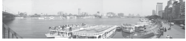
صورة رقم (1) لفظة بانورامية للضفة الشرقية للنيل وتوضح مراسي الزوارق والسفن النهرية

عبد المنعم رياض والذي يستغل كموقف أوتوبيس النقل الجماعي وسيارات الميكروباص.