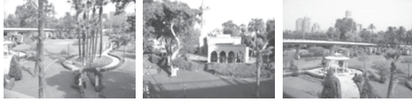
المصدر : الباحث , 2006

الترفيهي، ويتم ترك رصيف المشاه فقط علي الطريق للحركة الخارجية، وتبدأ الاستعمالات شمالا عند مركب Queen boat السياحي الذي يفصل بينها وبين مركب آخر وهي Imperial مشتل نباتات ثم مركب Nile maxim ومركب Le pacha وتنتهي الاستعمالات عند حديقة النهر التي يتوسطها مسجد ويعبر كوبري السادس من أكتوبر من فوقها. صورة رقم (3) حديقة النهر في نهاية القطاع الثالث لجزيرة الزمالك