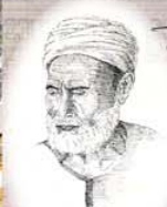
بورتريه قام برسمه د.عبد الباقي خامن موالده